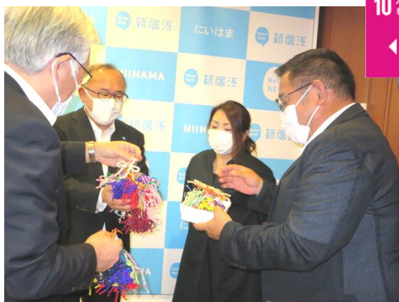
愛媛県人権対策協議会新居浜支部様より