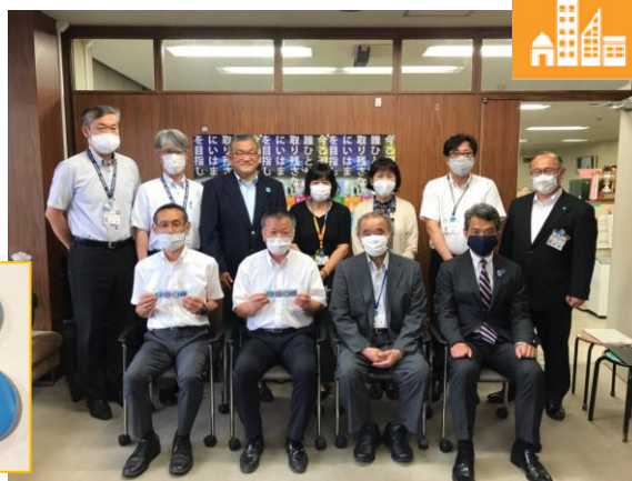
新居浜美術館&新居浜ユネスコ協会様より