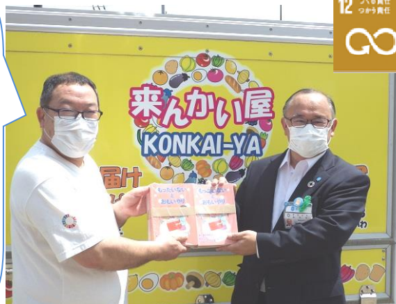
冊子『もったいないとおもいやり』